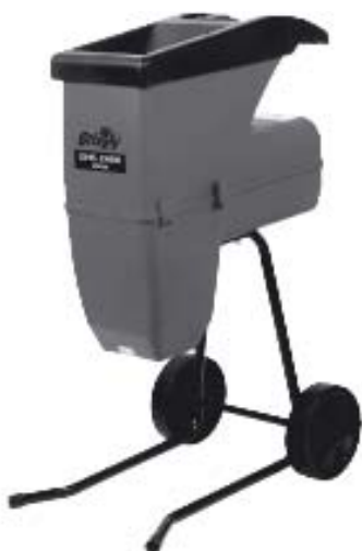
Model LSG 2500/ LSB2504

Biuro Handlowo-Usługowe, Andrzej Krysiak ul. Rolna 6 PL - 62-081 Baranowo Tel.: +48-61-650 75 30 Fax: +48-61-652 73 15